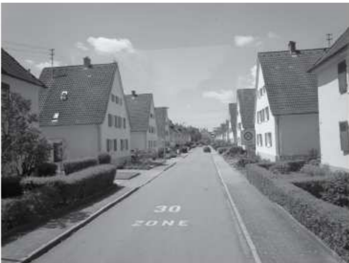
オッターベウレンへ向かう途中の街並み