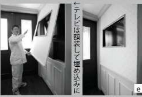
↑テレビは額装して埋め込みに