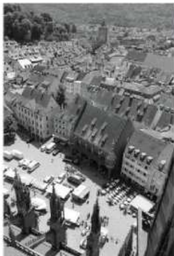
フライブルク旧市街地の街並み