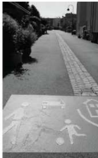
子供の遊び優先道路(ヴォーバン地区)