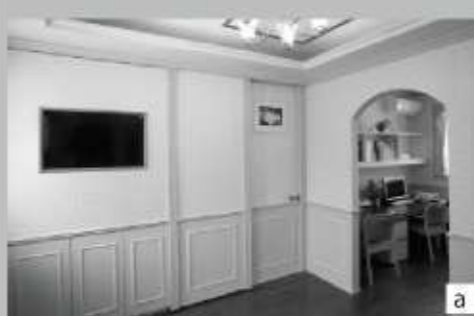
↓自宅への玄関ドア